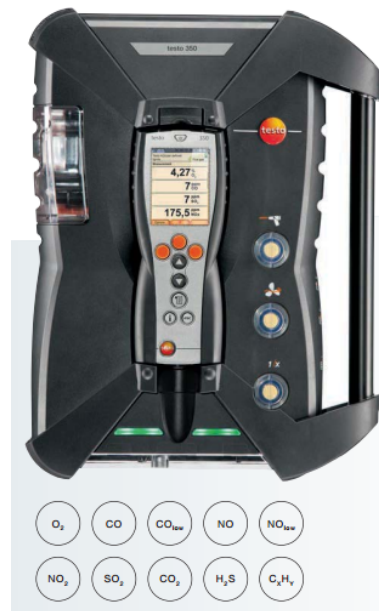
شکل ۴: دستگاه TESTO 350 آنالیز گاز [۴]

سایر تجهیزات بسته به این است که زیربنای آزمایشگاه براساس چه زمینه کاری نهاده شده باشد. آزمایشگاه‌هایی که در زمینه مهندسی مکانیک فعالیت می‌کنند، باید انواع سیکل‌های ترمودینامیکی، تونل باد و ... را دارا باشد تا محققین بتوانند در بخش‌های مختلف مهندسی مکانیک آزمایش‌های مورد نیاز را انجام دهند.