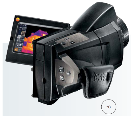
شکل ۶: وسیله TESTO 885 جهت اندازه‌گیری دماهای بالای تجهیزات [۴]