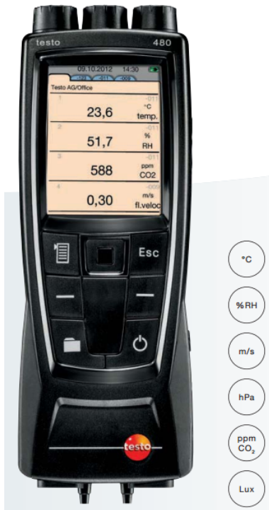
شکل ۵: وسیله TESTO 480 جهت اندازه‌گیری پارامترهای دما، فشار، سرعت [۴]

همانطور که گفته شد؛ انرژی بخش‌های مختلفی دارد بنابراین بهینه‌سازی انرژی نیز باید شامل بخش‌های مختلف آن شود تا بتوان در جهت کاهش مصرف بی‌رویه انرژی گام موثری برداشت. جهت بررسی انواع مختلف انرژی نیاز به تجهیزات مخصوص هر نوع می‌باشد. این تجهیزات با توجه به اهمیت موضوع، باید از دقت مناسبی برخوردار باشند. یکی از مهم‌ترین تجهیزات که باید در هر آزمایشگاه انرژی وجود داشته باشد، دستگاه آنالیز گازهای خروجی آگروز می‌باشد زیرا با توجه به گازهای خروجی از آگروز موتورهای احتراق داخلی و خارجی می‌توان به موارد زیادی همچون بهینه بودن میزان سوخت، وجود اکسیژن کافی در واکنش احتراق، دمای مناسب احتراق و ... پی برد. در شکل ۴ یکی از تجهیزات جهت تحلیل و بررسی گازها نمایش داده شده است. همانطور که مشاهده می‌شود گازهای قابل اندازه‌گیری در شکل ۴ ذکر شده است. به طور کلی این تجهیز برای کلیه مصرف کنندگان سوخت‌های فسیلی، کاربرد دارد و می‌تواند مشخص کند که وسیله مصرف کننده انرژی در چه وضعیتی قرار دارد.