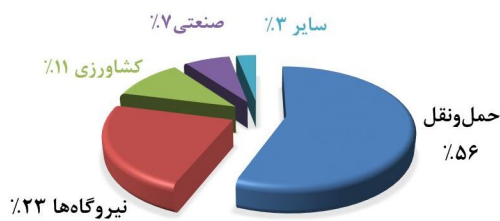
شکل ۲: سهم بخش‌های مختلف از مصرف گازوئیل [۴]