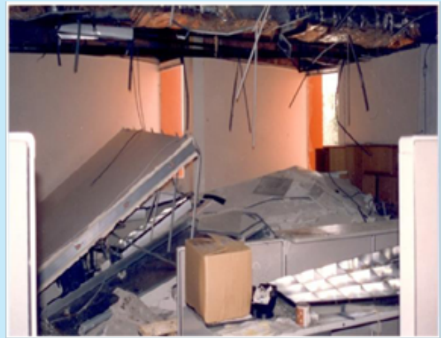
شکل ۱: گسیختگی و فروریزش پانل‌های سقفی و روشنایی، دبیرستان رزدا، زلزله ۱۹۹۴ نورث‌ریج، کالیفرنیا

خرابی در اعضای غیرسازه‌ای در زلزله‌های گذشته از دو لحاظ منشأ جدی تلفات و خسارت بوده است. این اعضا باید به گونه‌ای طراحی و اجرا گردند که نه تنها ممانعتی برای عملکرد سازه در زلزله ایجاد نکنند بلکه روی انسان‌ها، تجهیزات و محتویات آزمایشگاه آوار نشوند. به عنوان مثال در پی زلزله ۱۹۹۴ کالیفرنیا، نورث‌ریج با بزرگای ۶/۷ بیش از ۱۷۰ مدرسه در لس‌آنجلس دچار آسیب‌های غیرسازه‌ای شدند. در شکل ۱ یک کلاس درس دبیرستان در این منطقه نشان داده شده است که پانل‌های سقفی مربعی با ابعاد حدود ۳۰ سانتی‌متر همراه با اتصالات فلزی و ادوات روشنایی آن فرو ریخته‌اند.