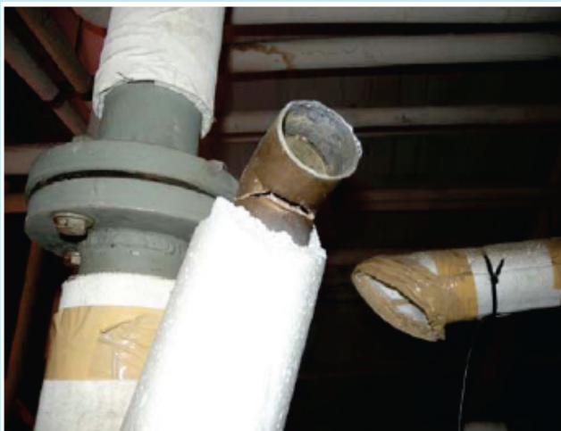
شکل ۲: شکستگی لوله متصل به دیگ بخار، بیمارستان سن‌کارلوس، زلزله ۲۰۱۰ شیلی